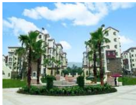
貴陽保利溫泉新城一期實景圖

本集團自2006年開始進駐貴陽市，於短短的3年時間內，憑藉開發速度和品質，已經發展成為當地最受歡迎的開發商之一，銷售成績有目共睹，保利溫泉新城銷售於2007至2008年連續兩年均名列前茅。「保利」品牌更成為當地居民認可的名牌。