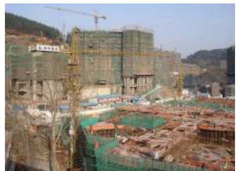
貴陽保利溫泉新城二期實景圖