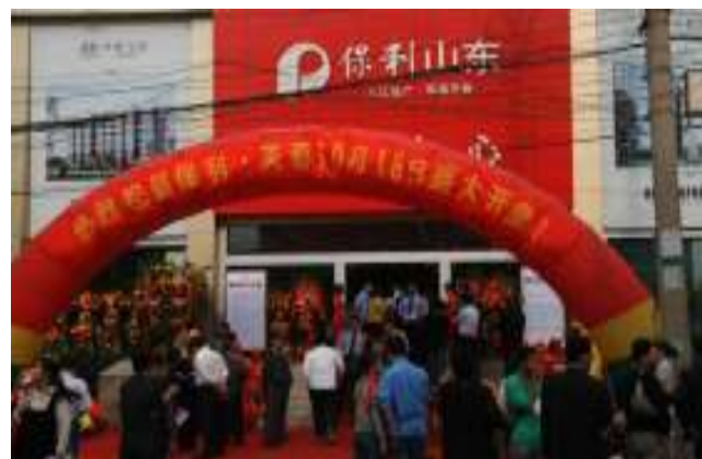
濟南保利芙蓉開盤現場

2008年第四季度總銷售面積約 18 萬平方米，包括新開售項目 6 個，分別為：廣州保利城、貴陽保利雲山國際、濟南保利芙蓉花園、哈爾濱保利水韻長灘、哈爾濱保利公園九號及上海金爵公寓。截至 2008 年 12 月 31 日，本集團在售項目合共 16 個， 2008 年累計售出面積約 51 萬平方米，符合 50-70 萬平方米的預期目標。