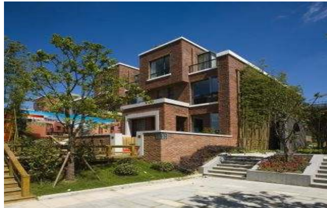
上海保利家園實景圖

本季度，集團的南寧保利龍騰上園、上海保利家園（別墅）、深圳海語西灣等項目已竣工開始交付買家使用，並擁有正在施工項目共 17 個，施工面積約 235 萬平方米。各項目基本按照計劃如常進行施工，在季內竣工項目包括深圳海語西灣、上海保利家園一期別墅、上海盛唐福邸，此外上海保利廣場已經在 12 月封頂；武漢保利華都一期正進行內部裝修，即將竣工。